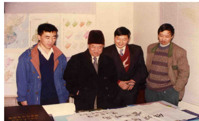
1996年和恩师中国科学院陈述彭院士在西安