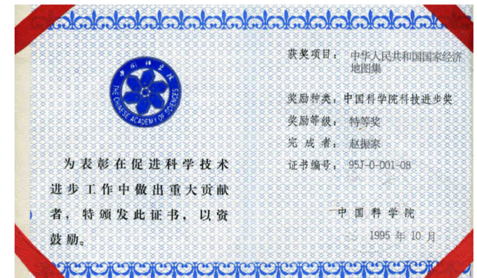
中国科学院科技进步特等奖证书1995年