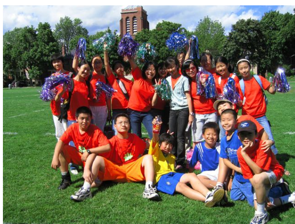
上左：英才足球队与拉拉队一起庆贺胜利