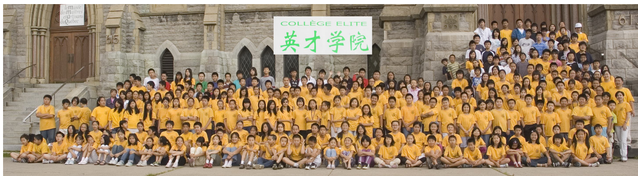
英才学院 2009 年第六届英才夏令营(第一营地)营员合照