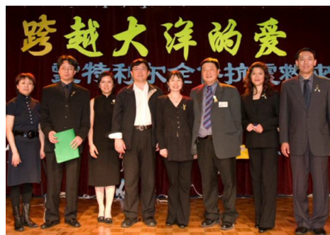
2008 蒙市华人华侨支援中国抗雪救灾筹款赈灾义演组织和主持人