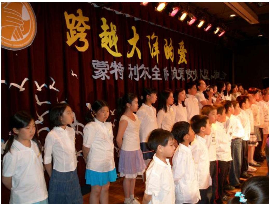
2008 蒙市华人华侨支援中国抗雪救灾筹款赈灾义演儿童合唱团